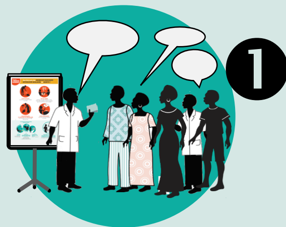
1 Communiquer sur les risques