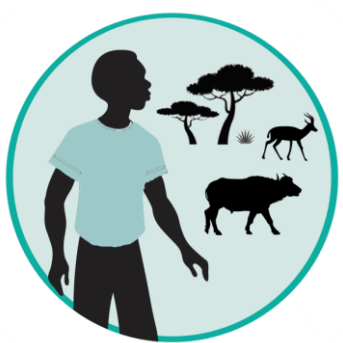
Services de l'environnement