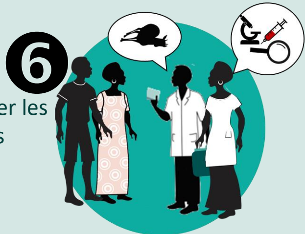
6 Communiquer les résultats