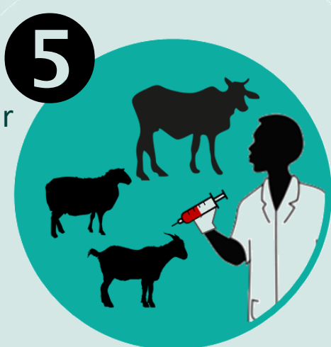
5 Investiguer autour des cas