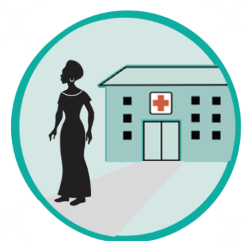
Services de santé publique