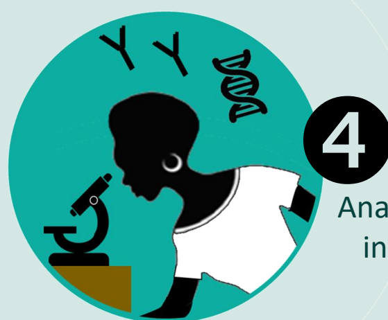
4 Analyser les échantillons et interpréter les résultats