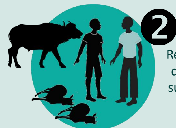
2 Rechercher et déclarer des suspicions de maladies