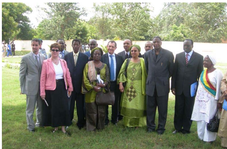
Le Premier Ministre Modibo SIDIBE a procédé à l'inauguration du CRSA de Bamako et au lancement de la campagne de vaccination 2007-2008