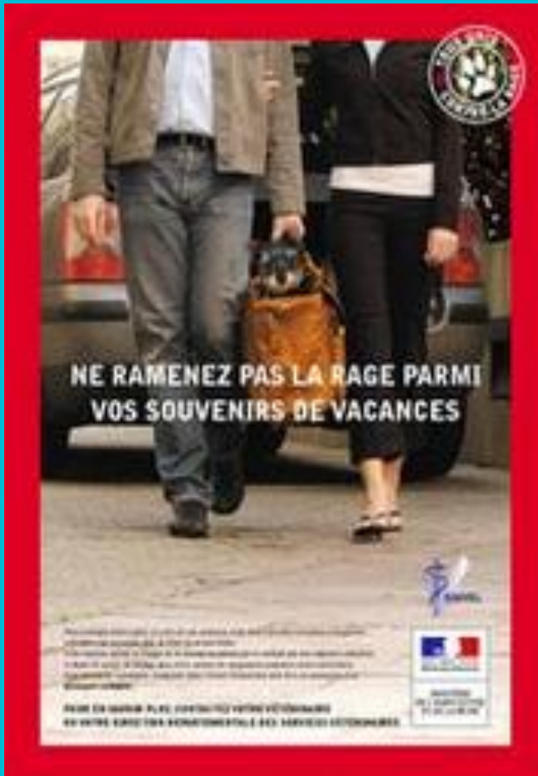
Campagne d'information d'août 2005