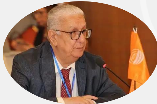
Dr Rachid Bouguedour Représentant, Représentation sous-régionale de l'OMSA (WOAH) pour l'Afrique du Nord