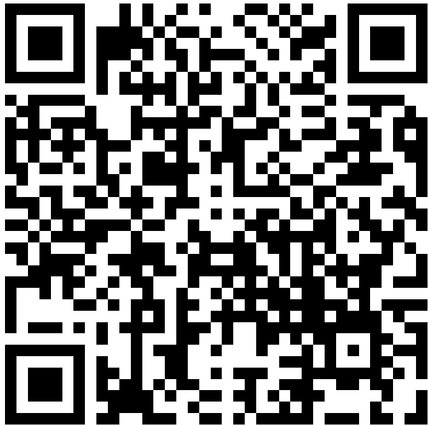
Agenda en français