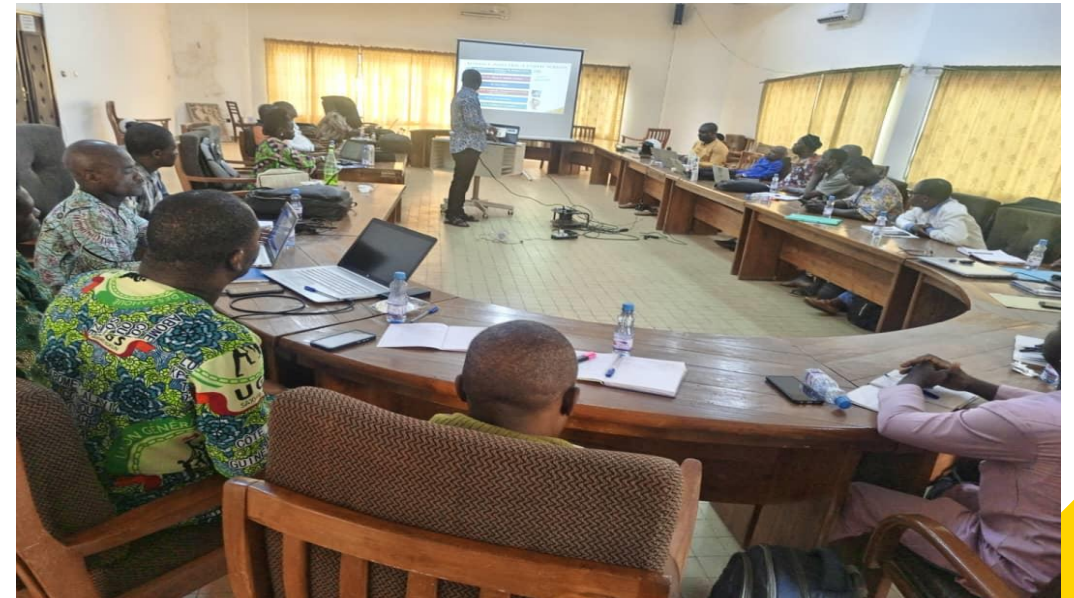
ATELIER DE FORMATION DES POINTS FOCaux DE SURVEILLANCE MARCHÉ DE MEDICAMENT VÉTÉRINAIRE, Bohicon, 17 au 19 avril 2024