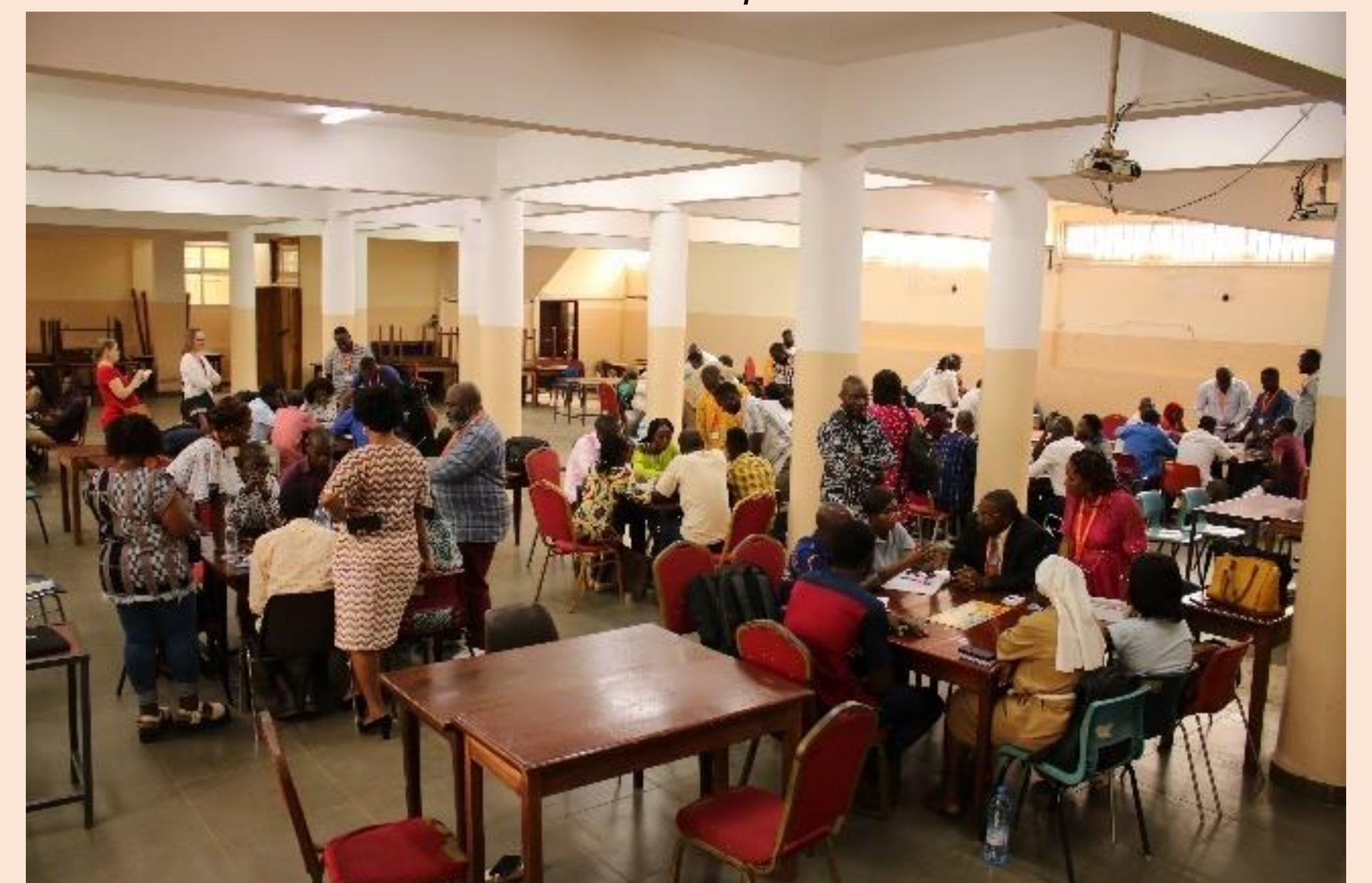
Démo avec les étudiants de l'université Catholique d'Afrique centrale, Yaoundé, Cameroun