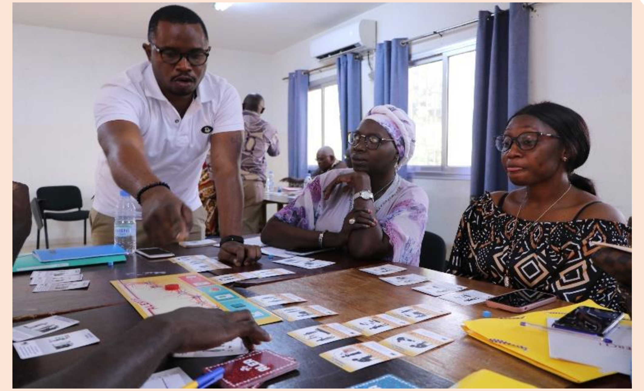
Explication du principe du jeu sérieux ALERTE aux animateurs; session de formation du Sénégal