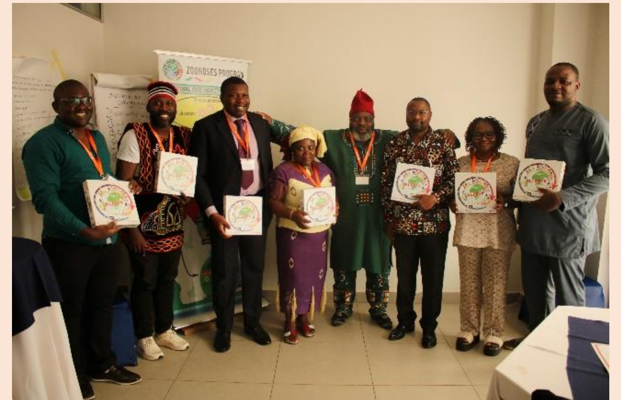
Remise des boîtes de jeu aux enseignants des écoles vétérinaires et PPV; session de formation du Cameroun.