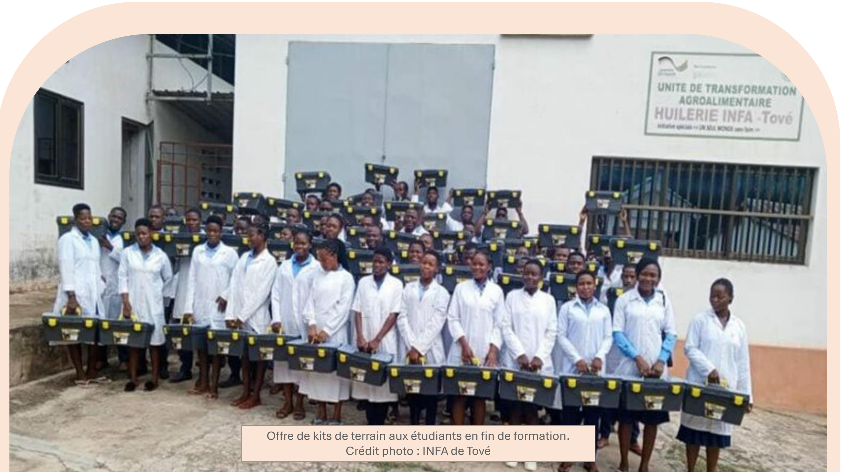
Offre de kits de terrain aux étudiants en fin de formation.