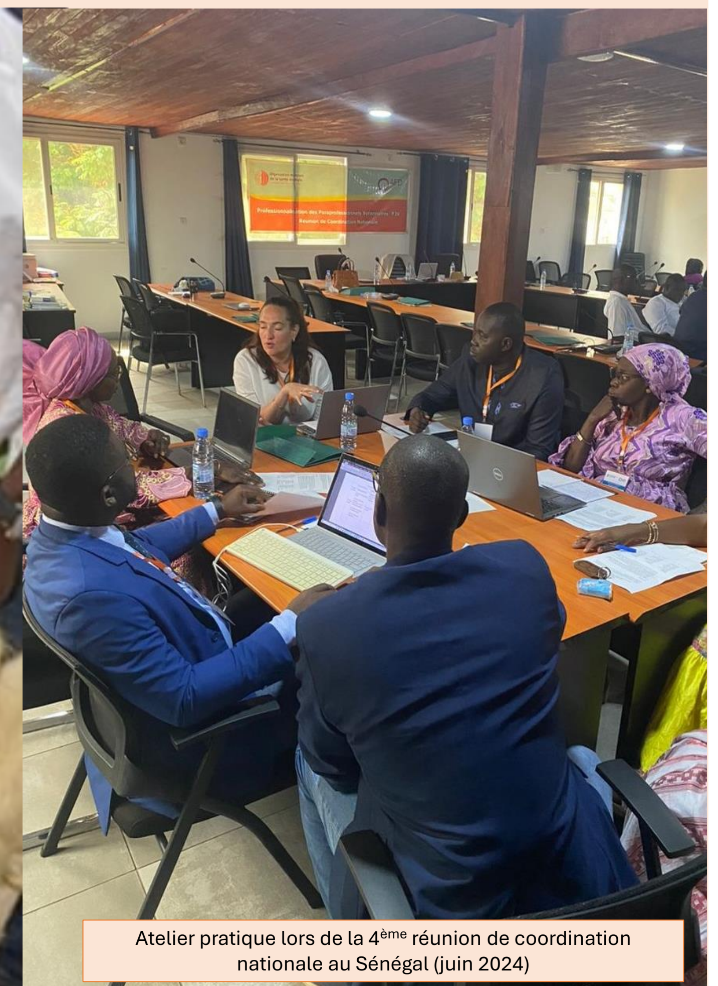
Atelier pratique lors de la 4 ème réunion de coordination nationale au Sénégal (juin 2024)