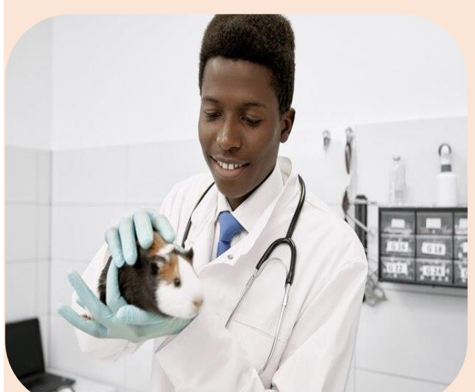
Mise en place de mini-laboratoires dans des cliniques vétérinaires au Sénégal et au Togo pour les stages des étudiants PPV