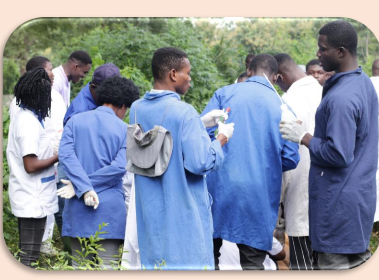
Création de dispositifs d'accompagnement pour l'insertion professionnelle des diplômés PPV