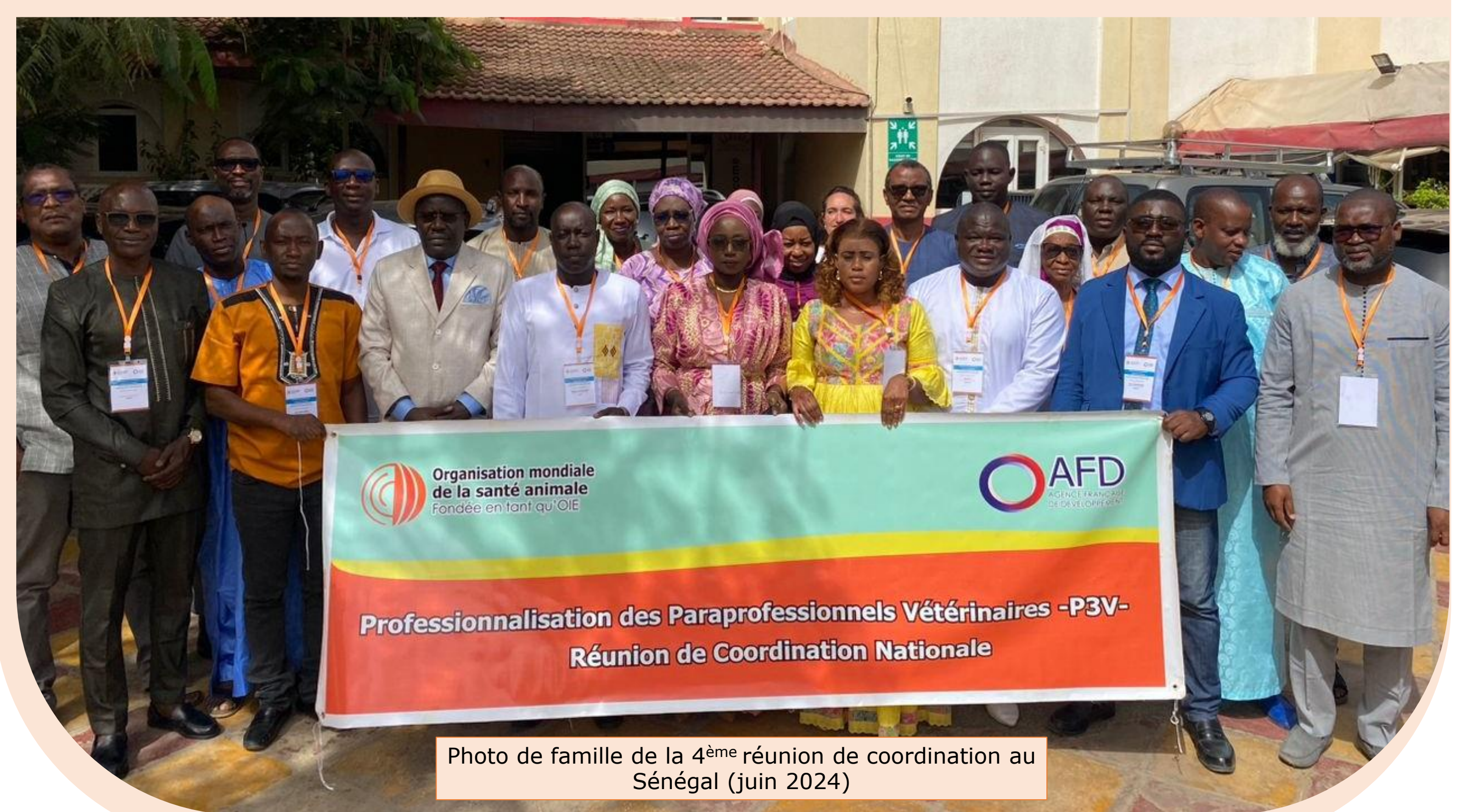
Photo de famille de la 4 ème réunion de coordination au Sénégal (juin 2024)