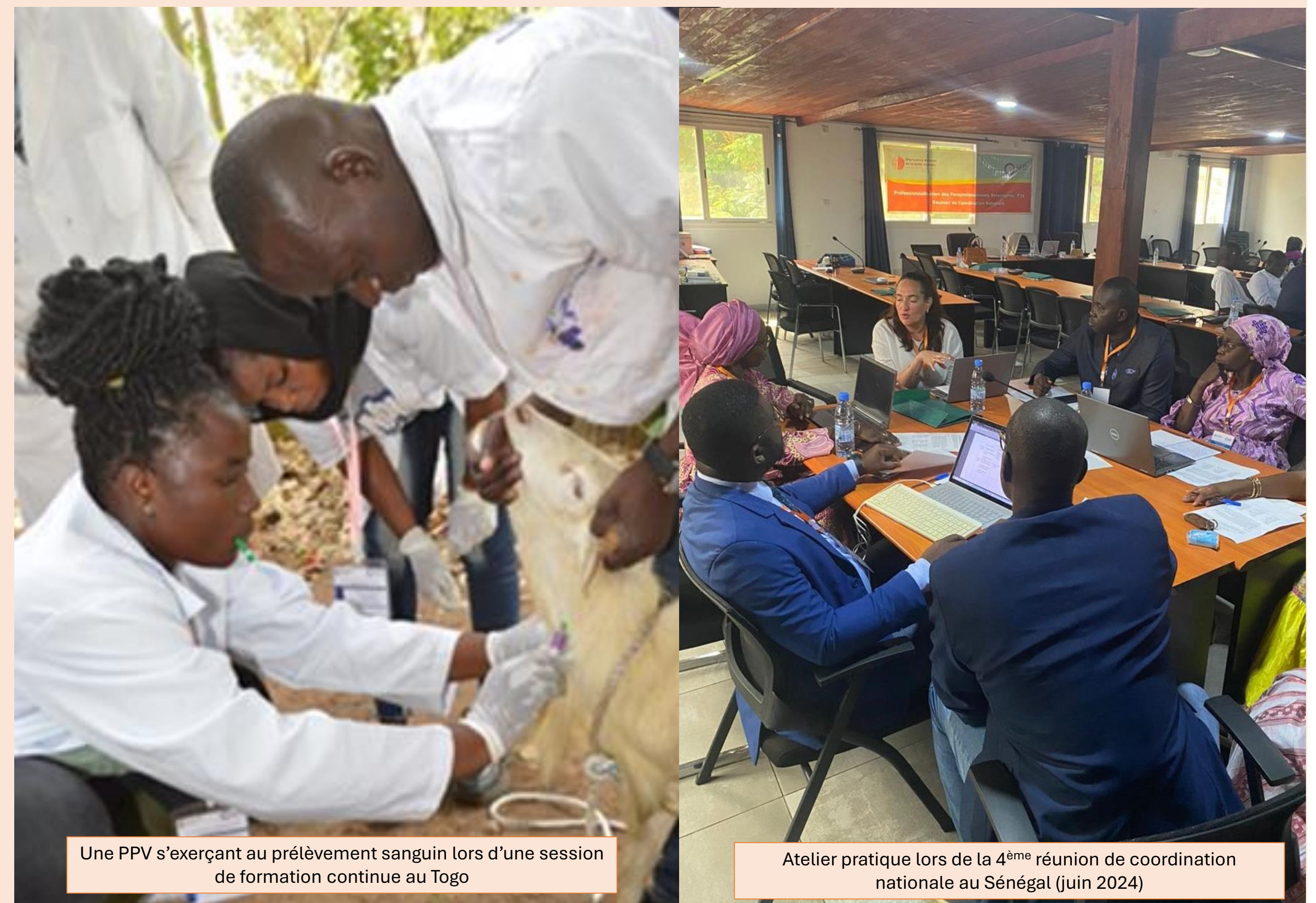
Une PPV s'exerçant au prélèvement sanguin lors d'une session de formation continue au Togo