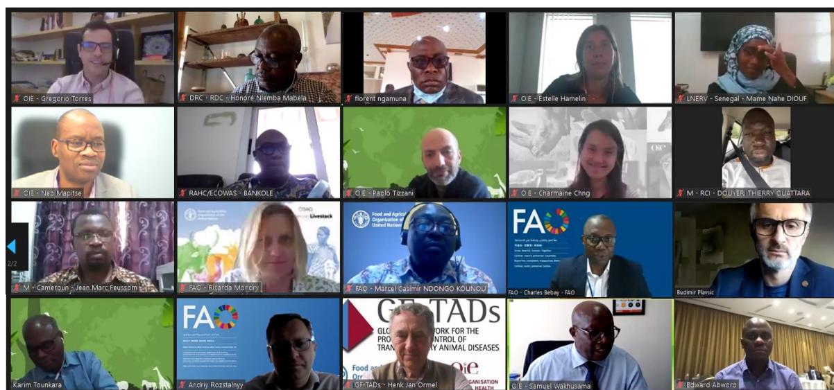
Capture d'écran d'une sélection de participants