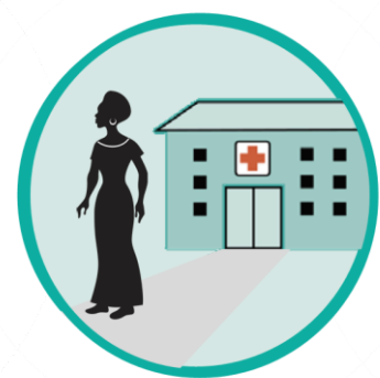
Services de santé publique